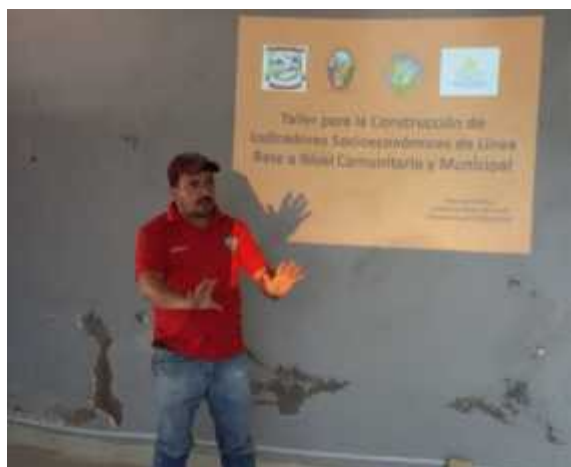
Alcalde Municipal concientizando sobre la importancia de la construcción de indicadores socioeconómicos (Línea base) del Municipio