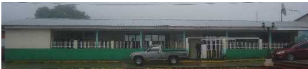
Foto Escuela Urbana Mixta Pedro Nufio