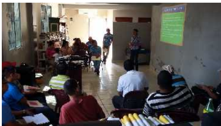
Capacitación a Líderes y lideresas sobre la construcción de indicadores socioeconómicos (Línea base)