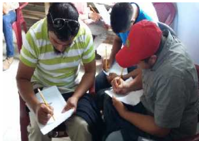
Líderes comunitarios realizando la práctica de llenado de la boleta