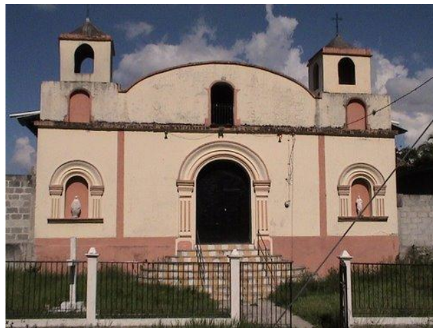
Iglesia catedral de San Juan de Opóa, Copán