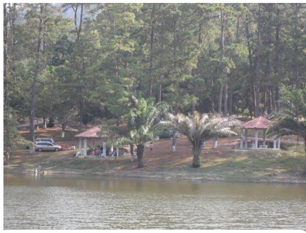
Parque de recreación turística, Laguna La Montañita de San Juan de Opóa, Copán