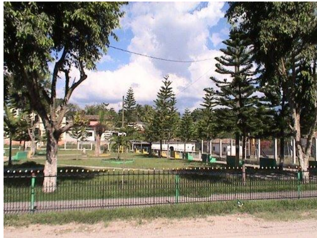
Parque Central de San Juan de Opóa, Copán